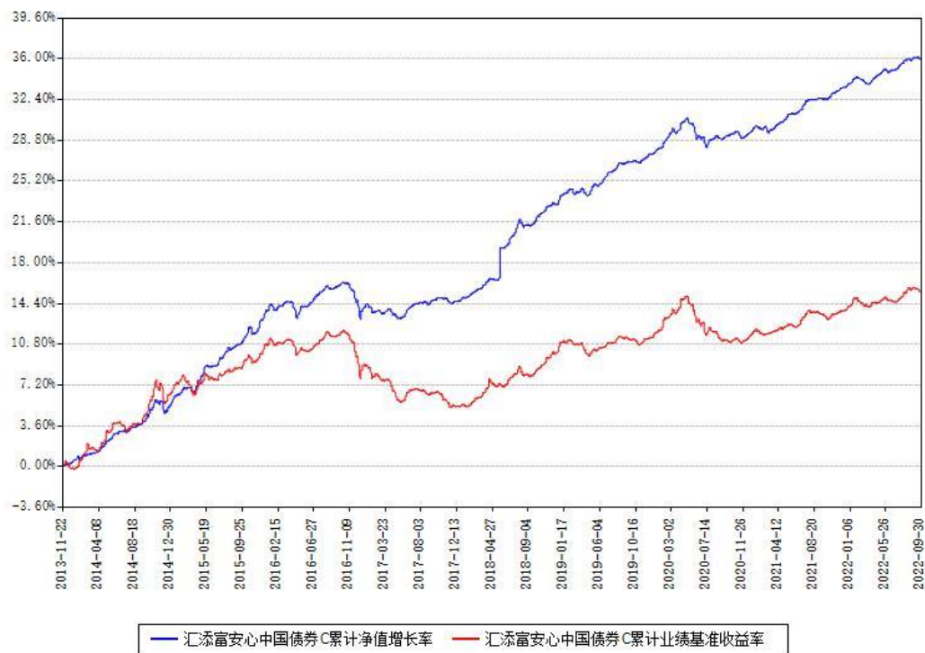
汇添富安心中国债券C累计净值增长率与同期业绩基准收益率对比图