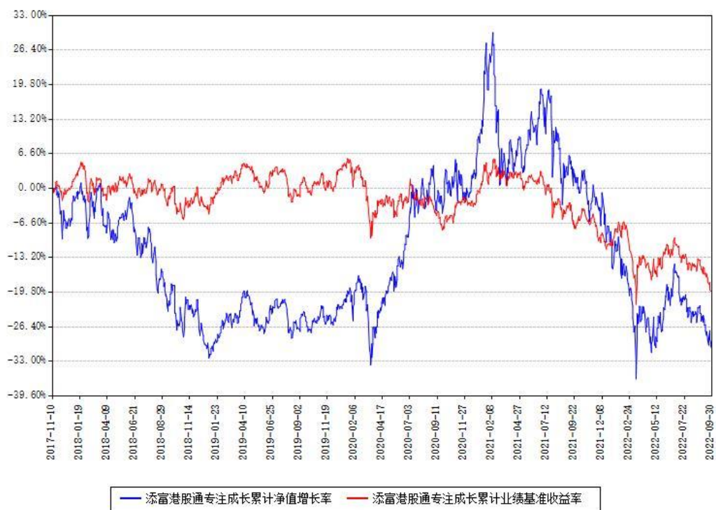
添富港股通专注成长累计净值增长率与同期业绩基准收益率对比图