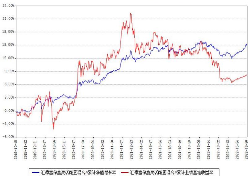
汇添富保鑫灵活配置混合A累计净值增长率与同期业绩基准收益率对比图

(二)自基金合同生效以来基金累计净值增长率变动及其与同期业绩比较基准收益率变动的比较图