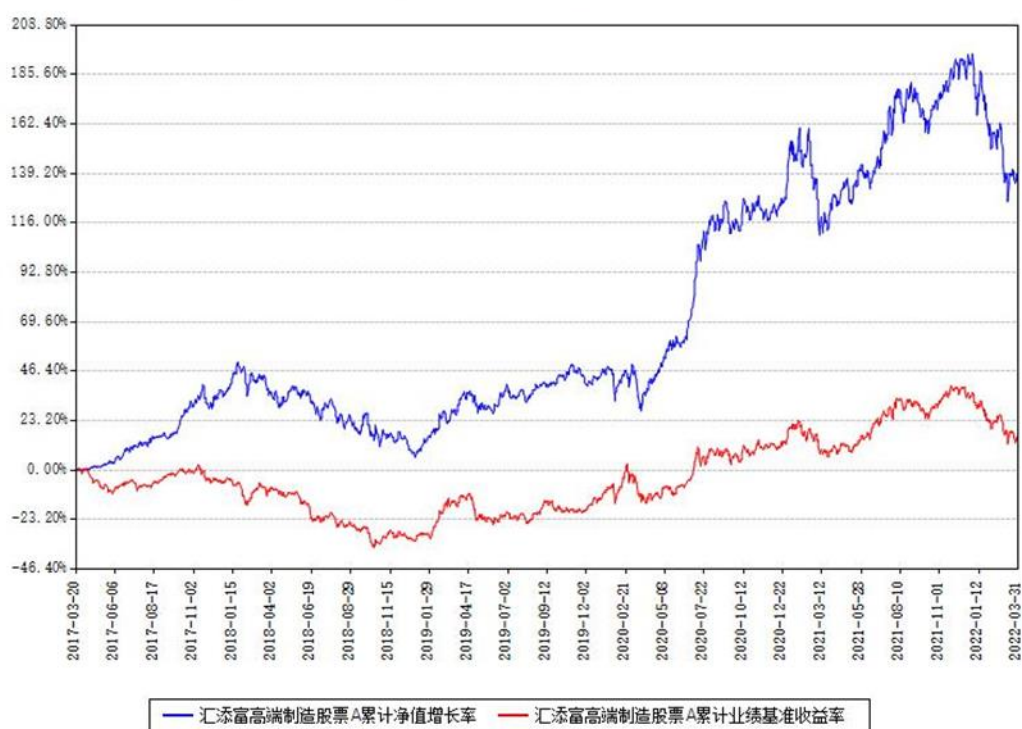
汇添富高端制造股票A累计净值增长率与同期业绩基准收益率对比图

(二)自基金合同生效以来基金累计净值增长率变动及其与同期业绩比较基准收益率变动的比较图