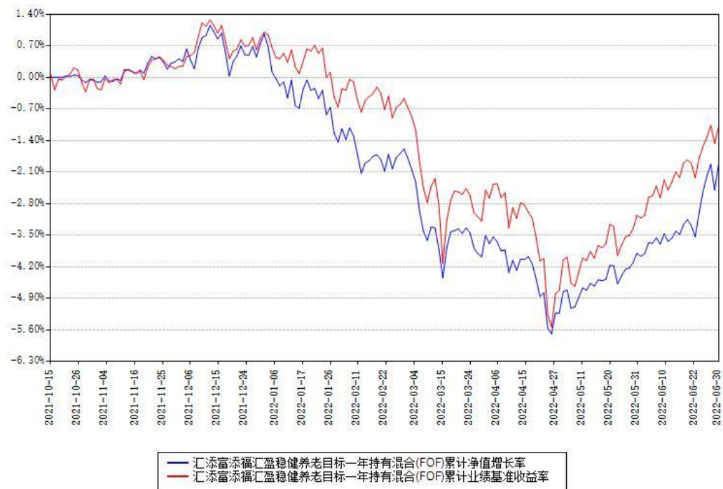
汇添富添福汇盈稳健养老目标一年持有混合(FOF)累计净值增长率与同期业绩基准收益率对比图