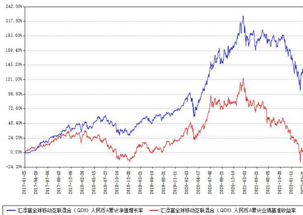
汇添富全球移动互联混合 (QDII) 人民币A累计净值增长率与同期业绩基准收益率对比图

(二)自基金合同生效以来基金累计净值增长率变动及其与同期业绩比较基准收益率变动的比较图