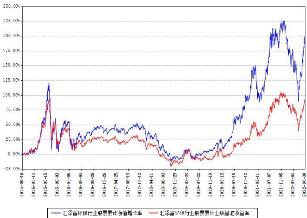
汇添富环保行业股票累计净值增长率与同期业绩基准收益率对比图