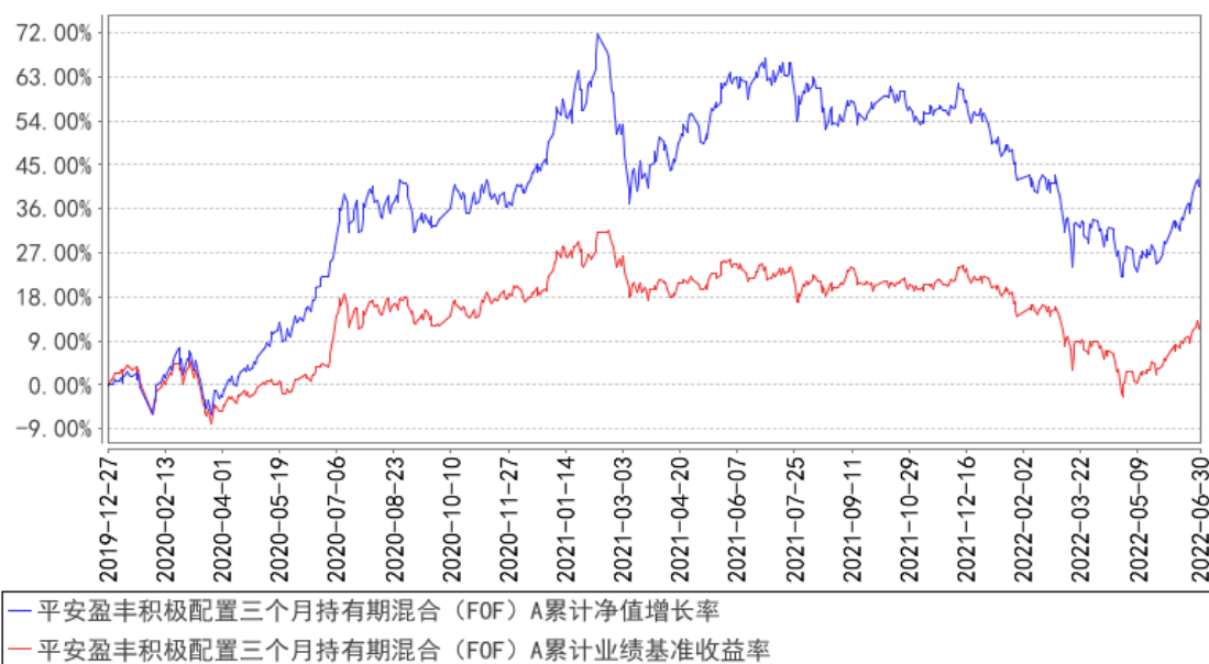
平安盈丰积极配置三个月持有期混合（FOF）A累计净值增长率与同期业绩比较基准收益率的历史走势对比图