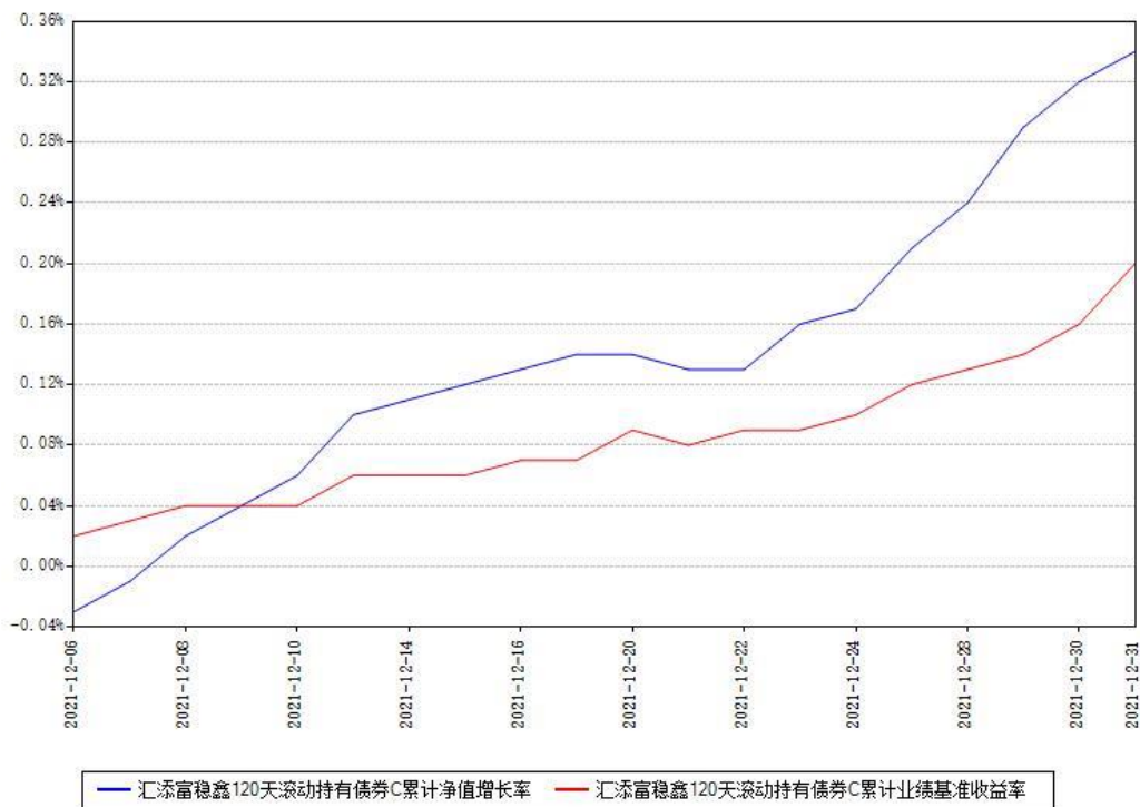
汇添富稳鑫120天滚动持有债券C累计净值增长率与同期业绩基准收益率对比图