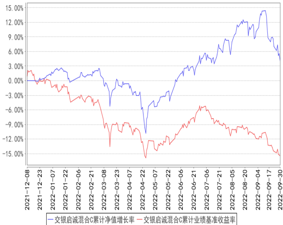
交银启诚混合C累计净值增长率与同期业绩比较基准收益率的历史走势对比图

注：本基金基金合同生效日为2021年12月8日，基金合同生效日至报告期末，本基金运作时间未满一年。本基金建仓期为自基金合同生效日起的6个月。截至建仓期结束，本基金各项资产配置比例符合基金合同及招募说明书有关投资比例的约定。