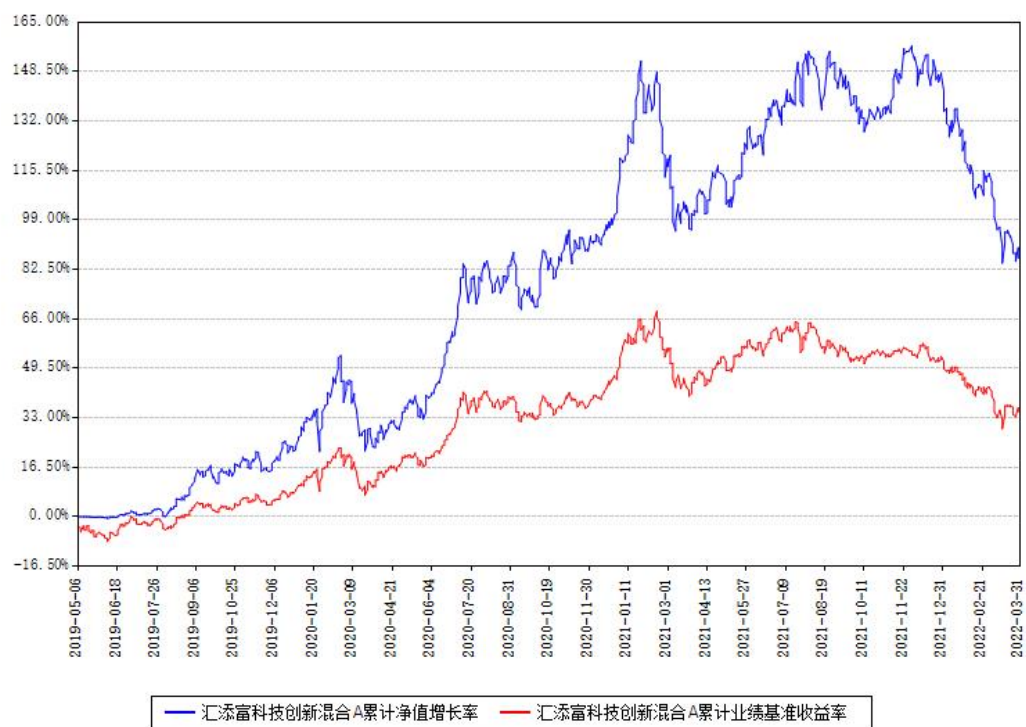
汇添富科技创新混合A累计净值增长率与同期业绩基准收益率对比图