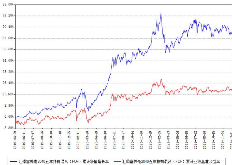
汇添富养老2040五年持有混合（FOF）累计净值增长率与同期业绩基准收益率对比图