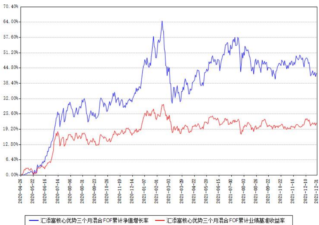
汇添富核心优势三个月混合FOF累计净值增长率与同期业绩基准收益率对比图