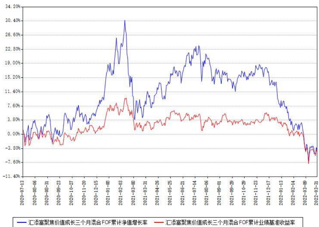
汇添富聚焦价值成长三个月混合FOF累计净值增长率与同期业绩基准收益率对比图