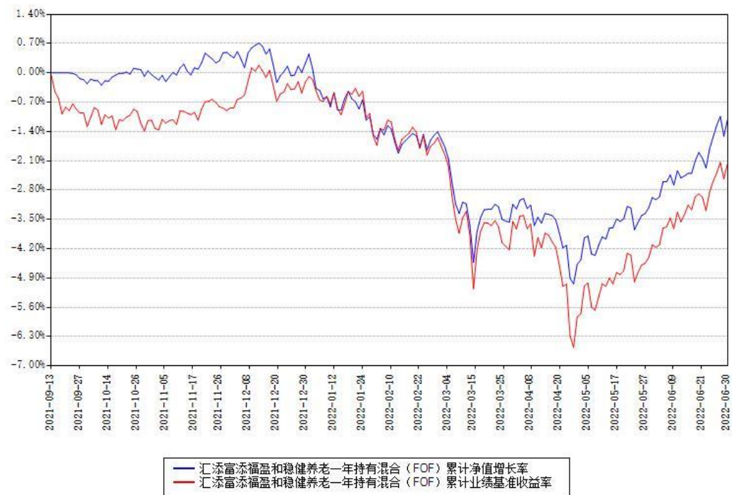
汇添富添福盈和稳健养老一年持有混合（FOF）累计净值增长率与同期业绩基准收益率对比图