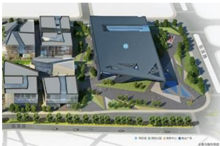
图 11-2 万科前海企业公馆项目图

项目园区设计新颖、大方。整个园区以纵横两条绿轴构成几何主轴，叠加三条南北贯穿的斜线，构建出小镇丰富而别致、自由而灵动的城市肌理。顺应总体规划中强调公共利益最大化的原则，在整体适宜步行的街区尺度里，合理地安排公共建筑、公共广场、园林景观和休闲运动设施，以达到便捷、舒适和富有趣味的空间体验。（如下图 11-2 所示）