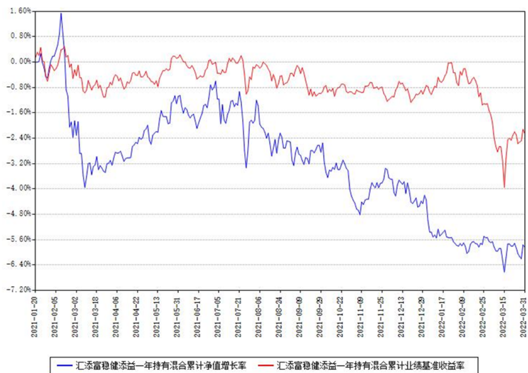
汇添富稳健添益一年持有混合累计净值增长率与同期业绩基准收益率对比图