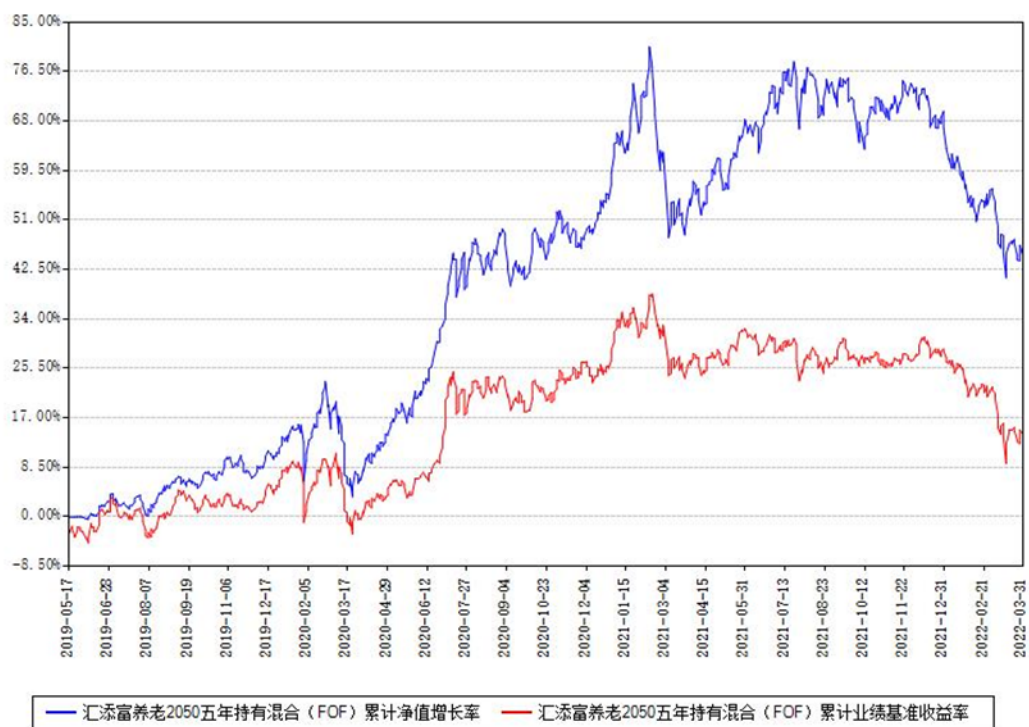
汇添富养老2050五年持有混合（FOF）累计净值增长率与同期业绩基准收益率对比图