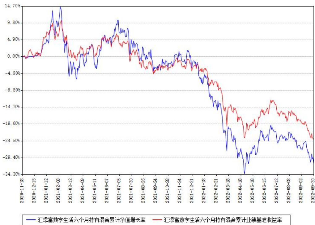
汇添富数字生活六个月持有混合累计净值增长率与同期业绩基准收益率对比图