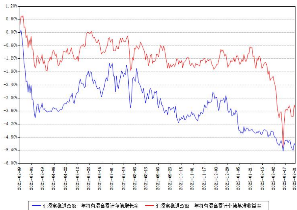
汇添富稳进双盈一年持有混合累计净值增长率与同期业绩基准收益率对比图