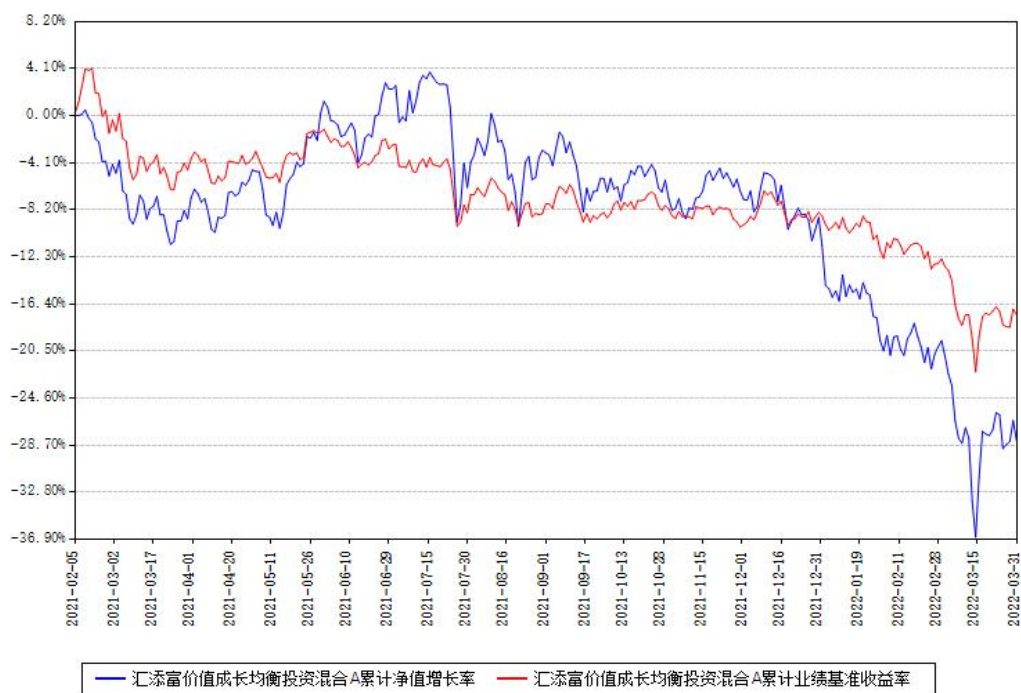
汇添富价值成长均衡投资混合A累计净值增长率与同期业绩基准收益率对比图