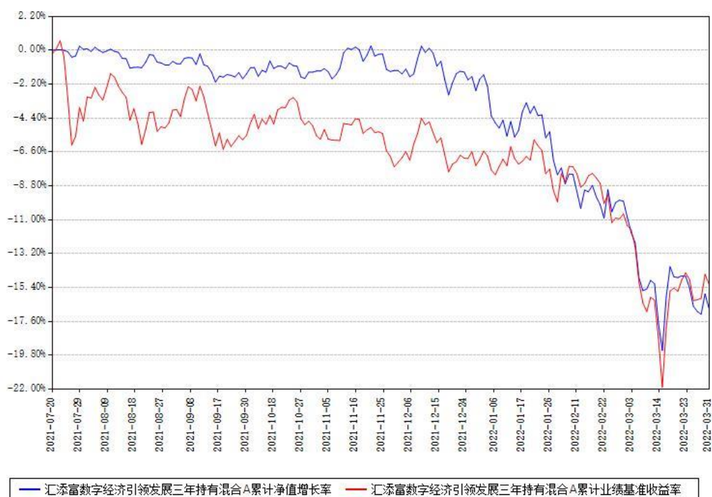
汇添富数字经济引领发展三年持有混合A累计净值增长率与同期业绩基准收益率对比图