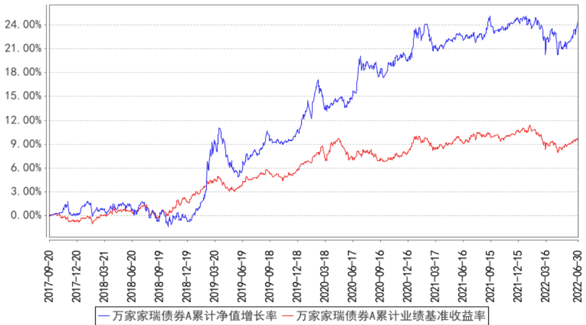
万家家瑞债券A累计净值增长率与同期业绩比较基准收益率的历史走势对比图

(二) 自基金合同生效以来基金份额净值的变动情况, 并与同期业绩比较基准的变动的比较