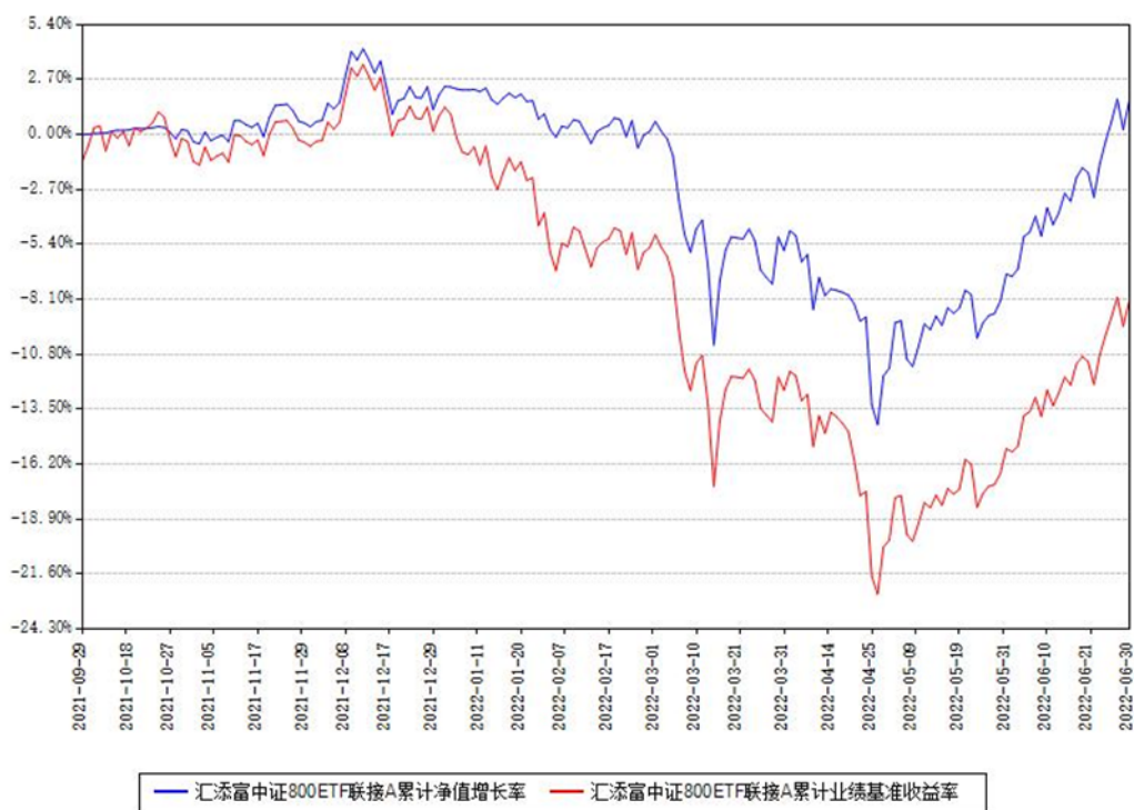
汇添富中证800ETF联接A累计净值增长率与同期业绩基准收益率对比图

(二) 自基金合同生效以来基金累计净值增长率变动及其与同期业绩比较基准收益率变动的比较图