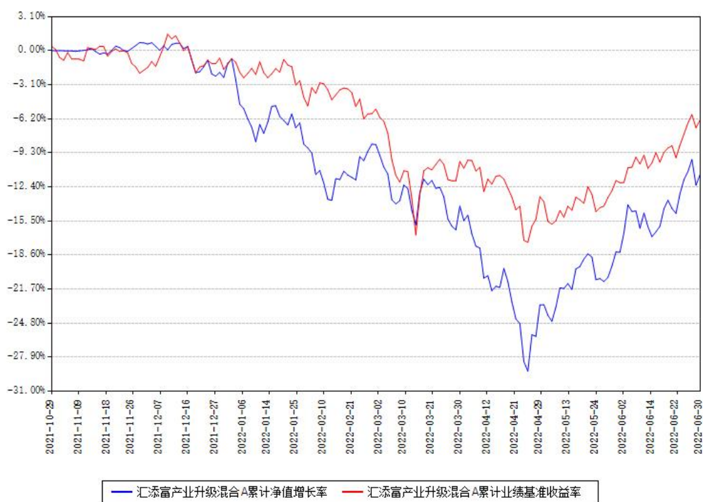
汇添富产业升级混合A累计净值增长率与同期业绩基准收益率对比图