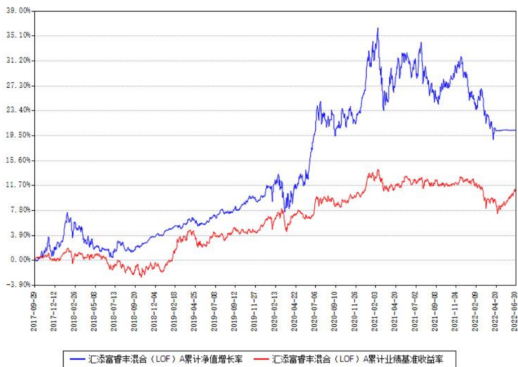
汇添富睿丰混合（LOF）A累计净值增长率与同期业绩基准收益率对比图

(二) 自基金合同生效以来基金累计净值增长率变动及其与同期业绩比较基准 收益率变动的比较图