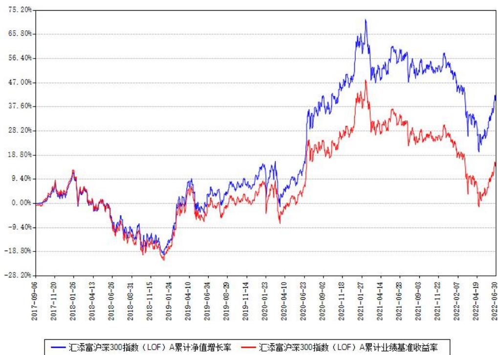
汇添富沪深300指数 (LOF) A 累计净值增长率与同期业绩比较基准收益率对比图