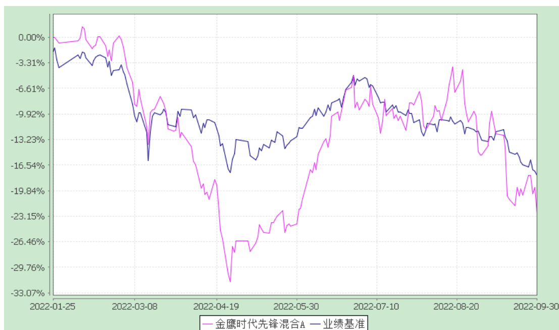
金鹰时代先锋混合 C: