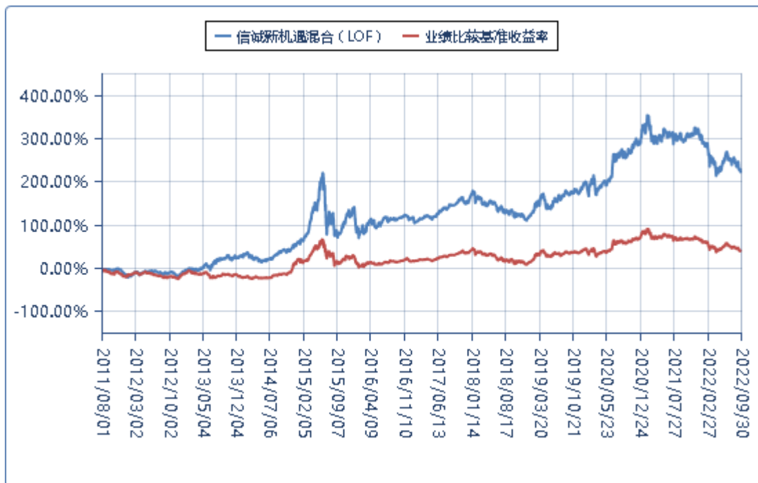
(二) 基金累计净值增长率与业绩比较基准收益率的历史走势对比图