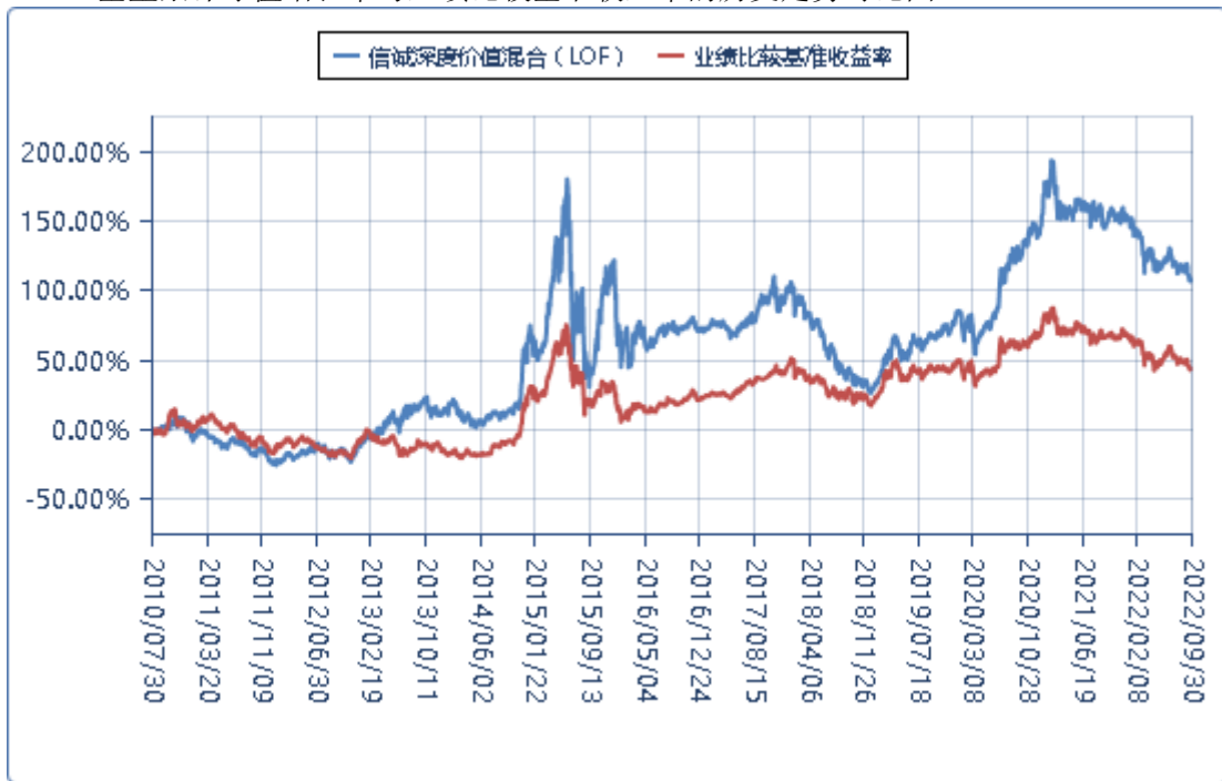
（二）基金累计净值增长率与业绩比较基准收益率的历史走势对比图