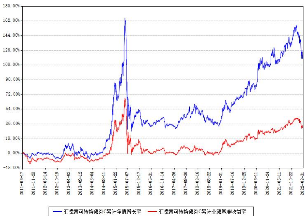
汇添富可转换债券C累计净值增长率与同期业绩基准收益率对比图