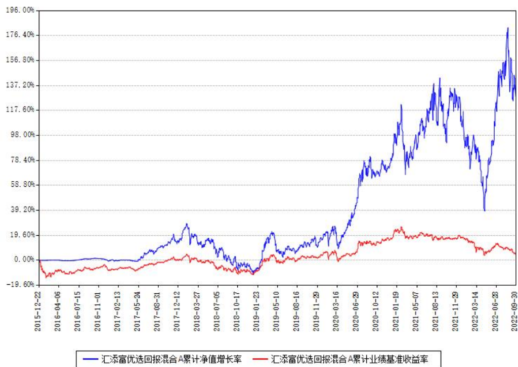
汇添富优选回报混合A累计净值增长率与同期业绩基准收益率对比图