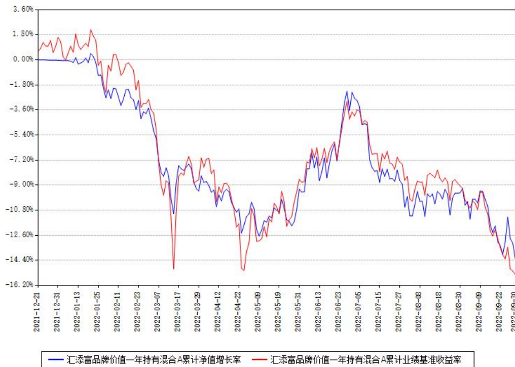
汇添富品牌价值一年持有混合A累计净值增长率与同期业绩基准收益率对比图