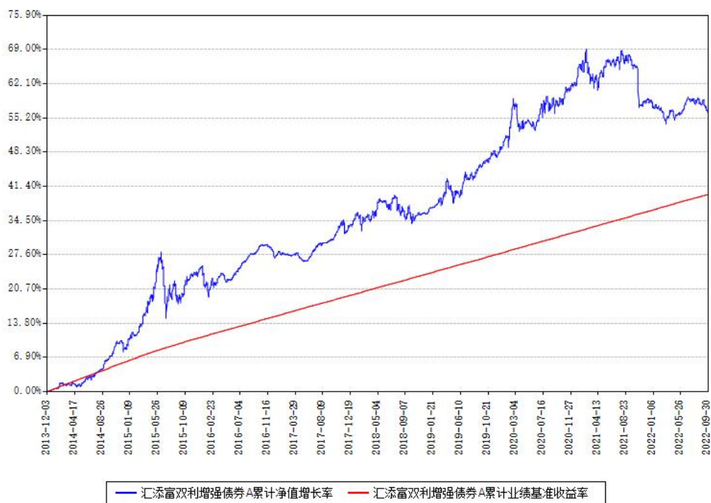
汇添富双利增强债券A累计净值增长率与同期业绩基准收益率对比图