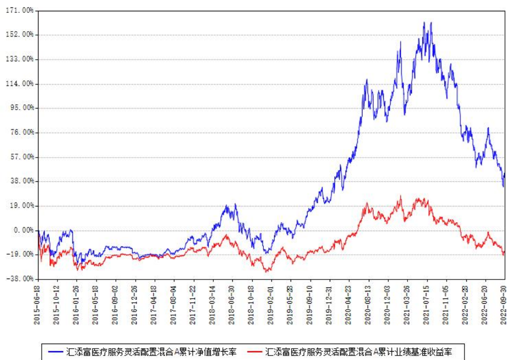
汇添富医疗服务灵活配置混合A累计净值增长率与同期业绩基准收益率对比图

(二) 自基金合同生效以来基金累计净值增长率变动及其与同期业绩比较基准收益率变动的比较图