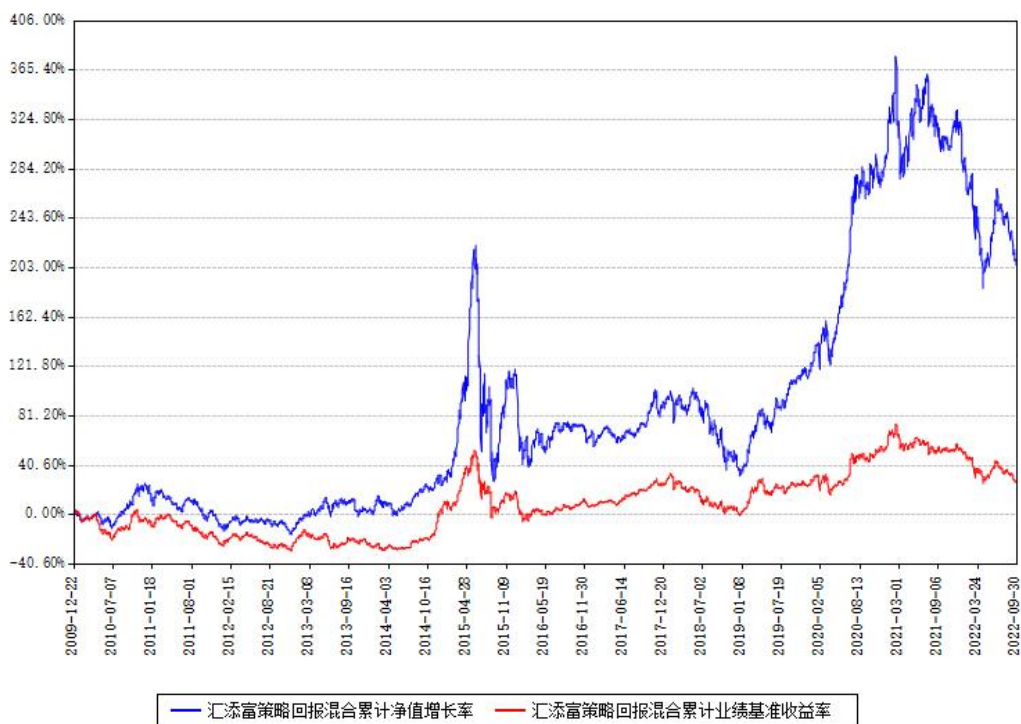
汇添富策略回报混合累计净值增长率与同期业绩基准收益率对比图

(二) 自基金合同生效以来基金累计净值增长率变动及其与同期业绩比较基准收益率变动的比较图