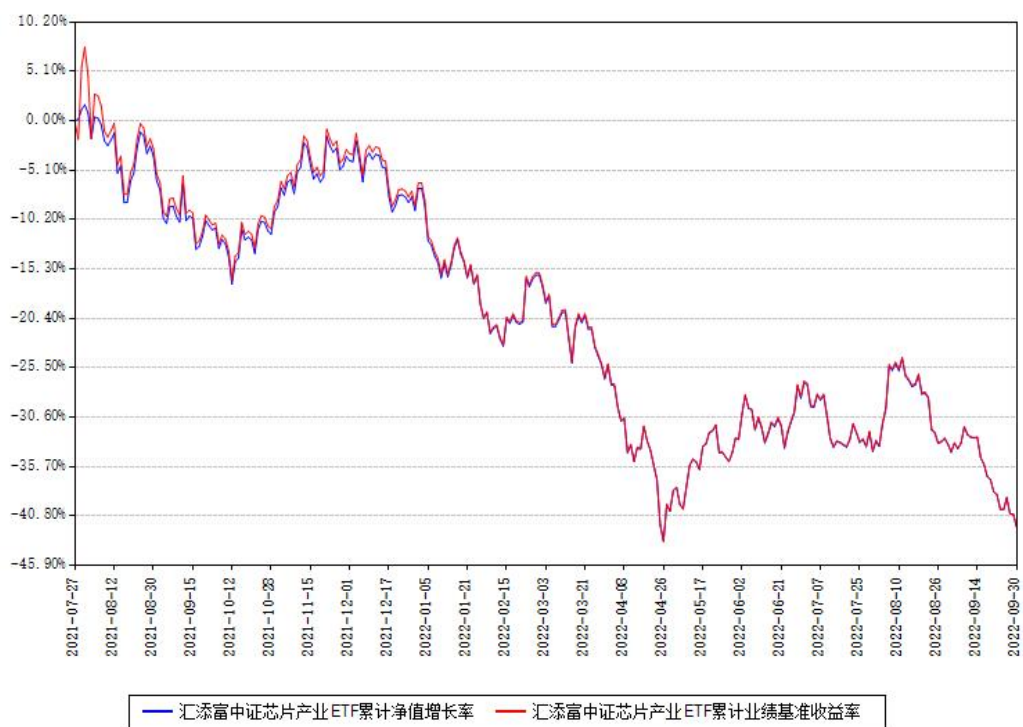
汇添富中证芯片产业ETF累计净值增长率与同期业绩基准收益率对比图