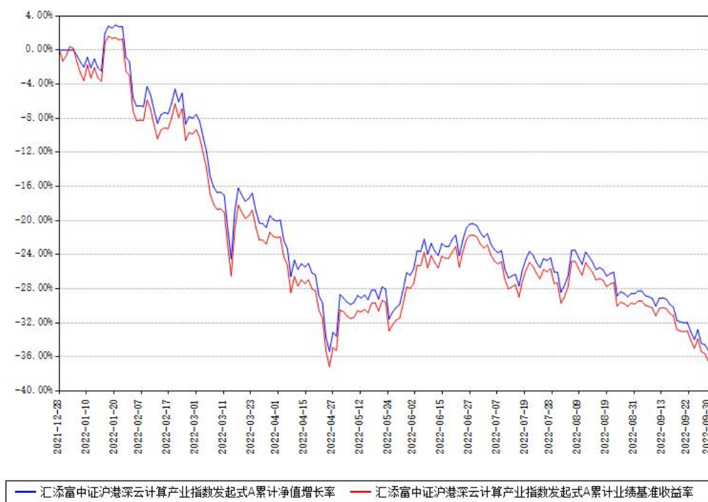
汇添富中证沪港深云计算产业指数发起式A累计净值增长率与同期业绩基准收益率对比图