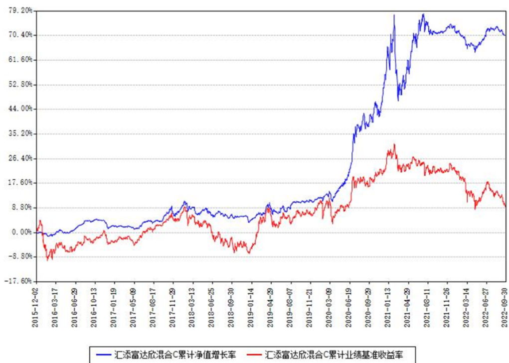
汇添富达欣混合C累计净值增长率与同期业绩基准收益率对比图