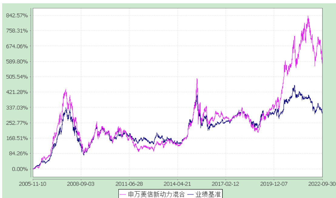
申万菱信新动力混合型证券投资基金 累计净值增长率与业绩比较基准收益率历史走势对比图 (2005年11月10日至2022年9月30日)

2. 自《基金合同》生效以来基金份额累计净值增长率与同期业绩比较基准的变动比较。