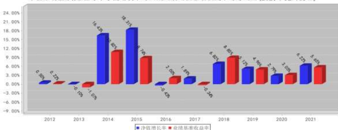
平安添利债券A基金每年净值增长率与同期业绩比较基准收益率的对比图(2021年12月31日)