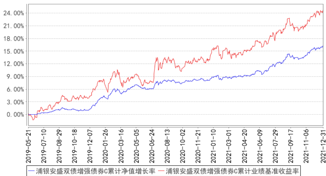
浦银安盛双债增强债券C累计净值增长率与同期业绩比较基准收益率的历史走势对比图