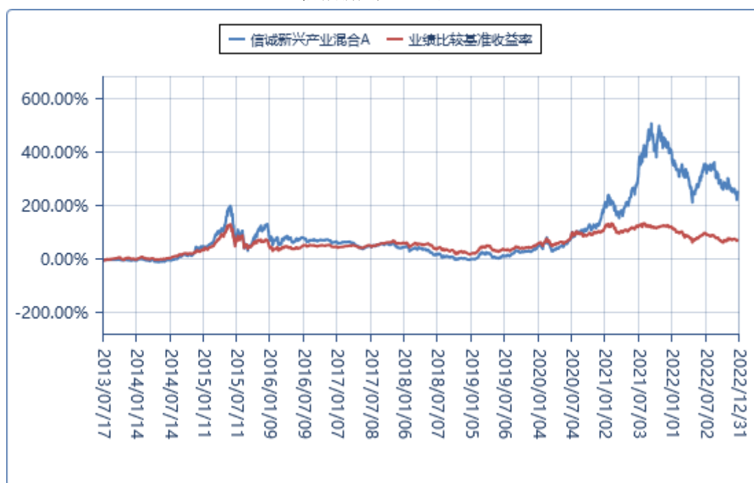
信诚新兴产业混合 C