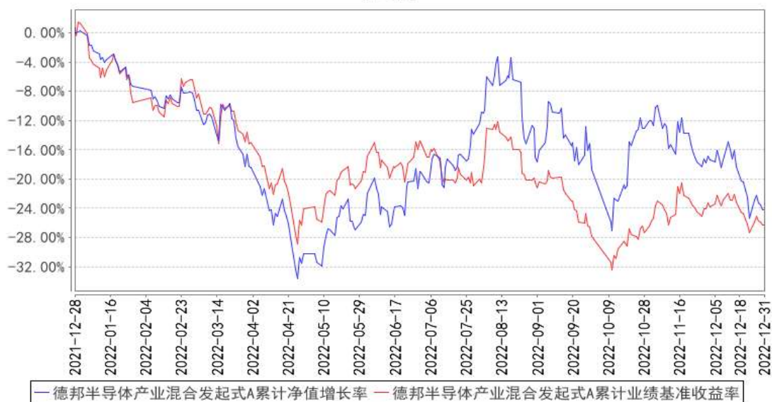
德邦半导体产业混合发起式A累计净值增长率与同期业绩比较基准收益率的历史走势对比图