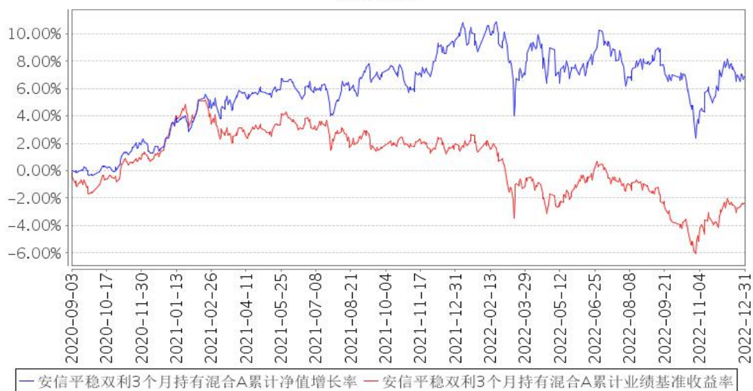
安信平稳双利3个月持有混合A累计净值增长率与同期业绩比较基准收益率的历史走势对比图