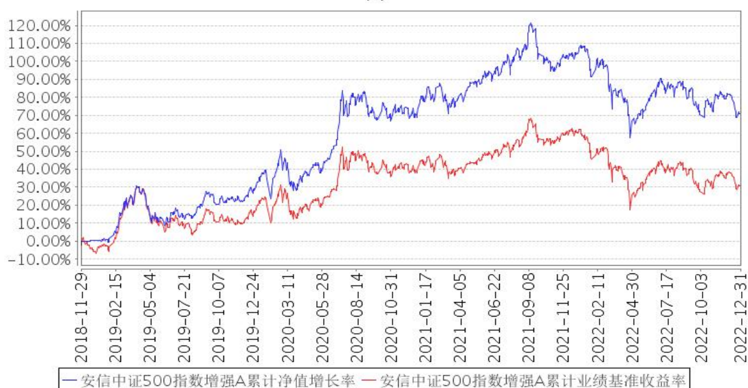
安信中证500指数增强A累计净值增长率与同期业绩比较基准收益率的历史走势对比图