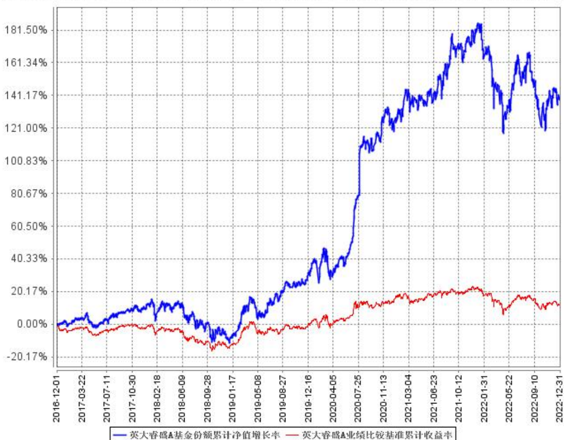
英大睿盛A基金份额累计净值增长率与同期业绩比较基准收益率的历史走势对比图