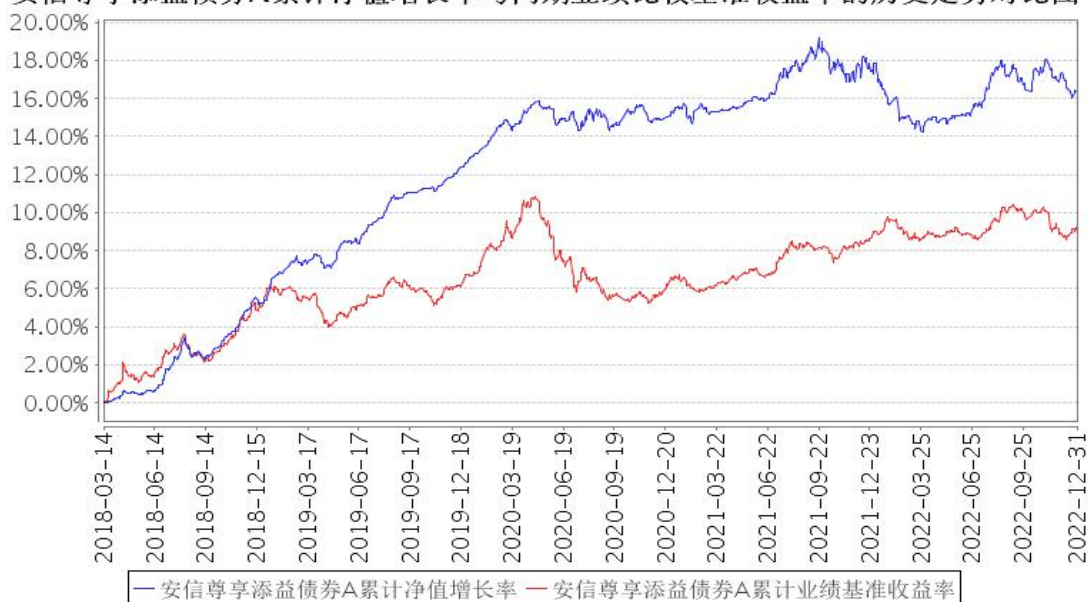
安信尊享添益债券A累计净值增长率与同期业绩比较基准收益率的历史走势对比图