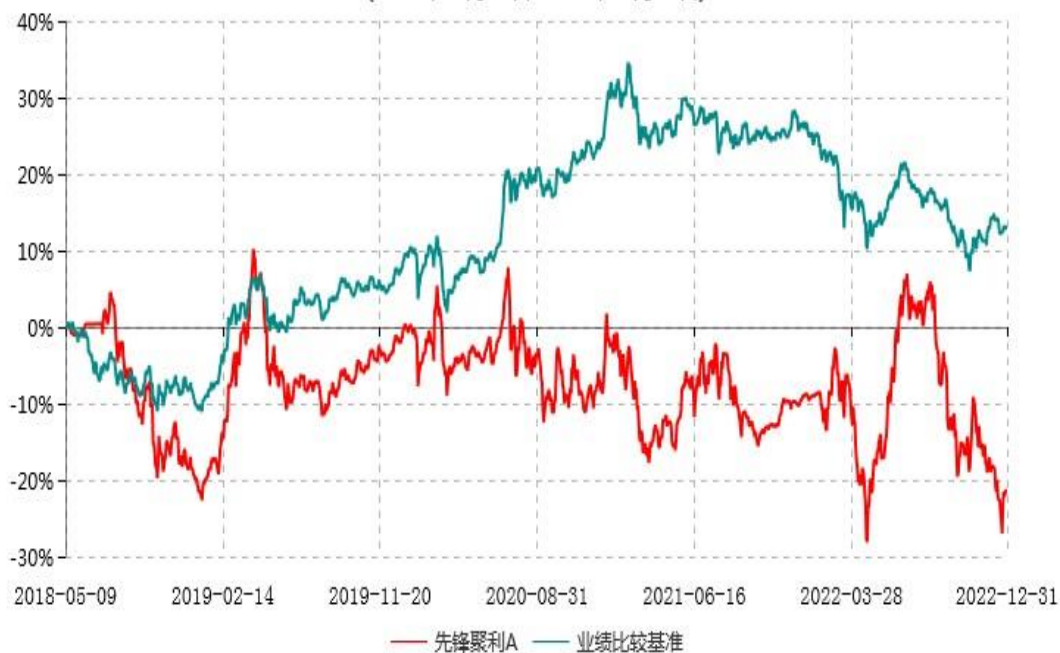
先锋聚利A累计净值增长率与业绩比较基准收益率历史走势对比图 (2018年05月09日-2022年12月31日)