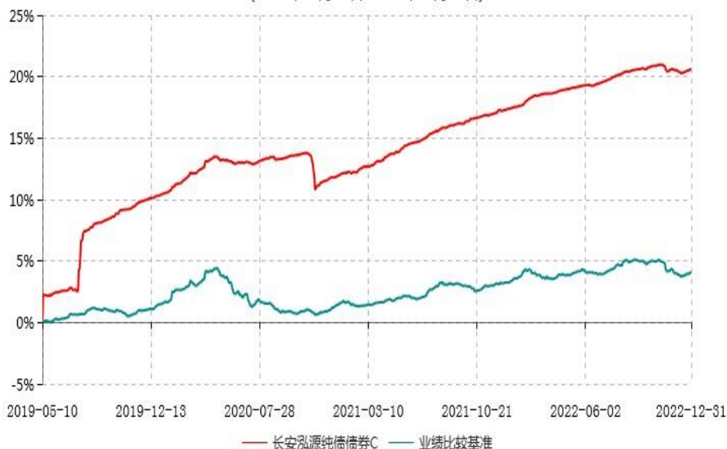
长安泓源纯债债券C累计净值增长率与业绩比较基准收益率历史走势对比图 (2019年05月10日-2022年12月31日)